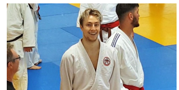
Le sourire de la victoire

22 juin : Démonstrations, essais, inscriptions et échanges autour d'un rafraîchissement, tel était le menu de notre journée 'Portes Ouvertes'.